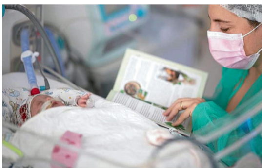
Un neonato pretermine ascolta la voce della mamma

I miglioramenti sullo sviluppo neurologico e respiratorio risultano evidenti: «Il battito cardiaco si normalizza, aumenta l'ossigenazione, la temperatura della mamma li riscalda. I benefici di queste sedute hanno effetti anche sulle secrezioni ormonali materne e paterne, sul benessere di genitori che si sentono coinvolti. Con le dovute cautele, auspichiamo che questa pratica sicura si diffonda nelle terapie intensive neonatali, perché non mette a rischio la salute del bambino». A Modena nel 2022 è stato adottato con successo questo approccio «con 56 prematuri dal peso alla nascita inferiore ai 1.500 grammi, la categoria più a rischio, ma anche con gli altri nati pretermine, 200 in totale. Per tutti i genitori è un trauma vivere il distacco precoce nel timore delle possibili conseguenze. Nell'incubatrice cerchiamo di riprodurre un nido che mimi la forma dell'utero materno, con panni arrotolati per un maggiore contenimento e stabilità strutturale». Cruciale il ruolo delle famiglie pure in vista di futuri comportamenti durante l'infanzia e