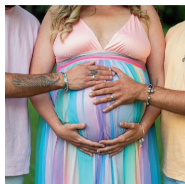
L'immagine di JA Surrogacy su Facebook

I media canadesi raccontano di numerosi genitori committenti che hanno versato dai duemila ai tremila dollari al mese alle donne che portavano in grembo il «loro» figlio, ottenendo dall'agenzia ricevute parziali, doppie o con date precedenti la gravidanza. Ma in una situazione dai contorni grigi sono soprattutto le madri surrogate a trovarsi fra l'incudine e il martello. Sempre i media canadesi raccontano di come molte donne si siano sentite manipolate e tradite da agenzie come la JA Surrogacy che promettevano «almeno 30mila dollari di retribuzione», salvo poi minacciarle se mandavano scontrini della spesa troppo elevati, con multe salate o persino la prigione, come prevede la legge per chi la trasgredisce. Forse anche per questo ogni anno nel Parlamento federale canadese si levano voci di deputati o senatori che invitano a far cadere il velo dell'ipocrisia e a legalizzare la maternità surrogata commerciale, come avviene già nella maggior parte degli Stati americani.