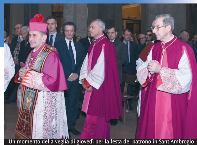
Un momento della veglia di giovedì per la festa del patrono in Sant'Ambrogio

Pensare non è solo analisi e calcolo Sono diffuse le tentazioni ad asservire il pensiero alle mode del momento, piuttosto che esercitare la responsabilità di un pensiero critico. «Tra le ten-