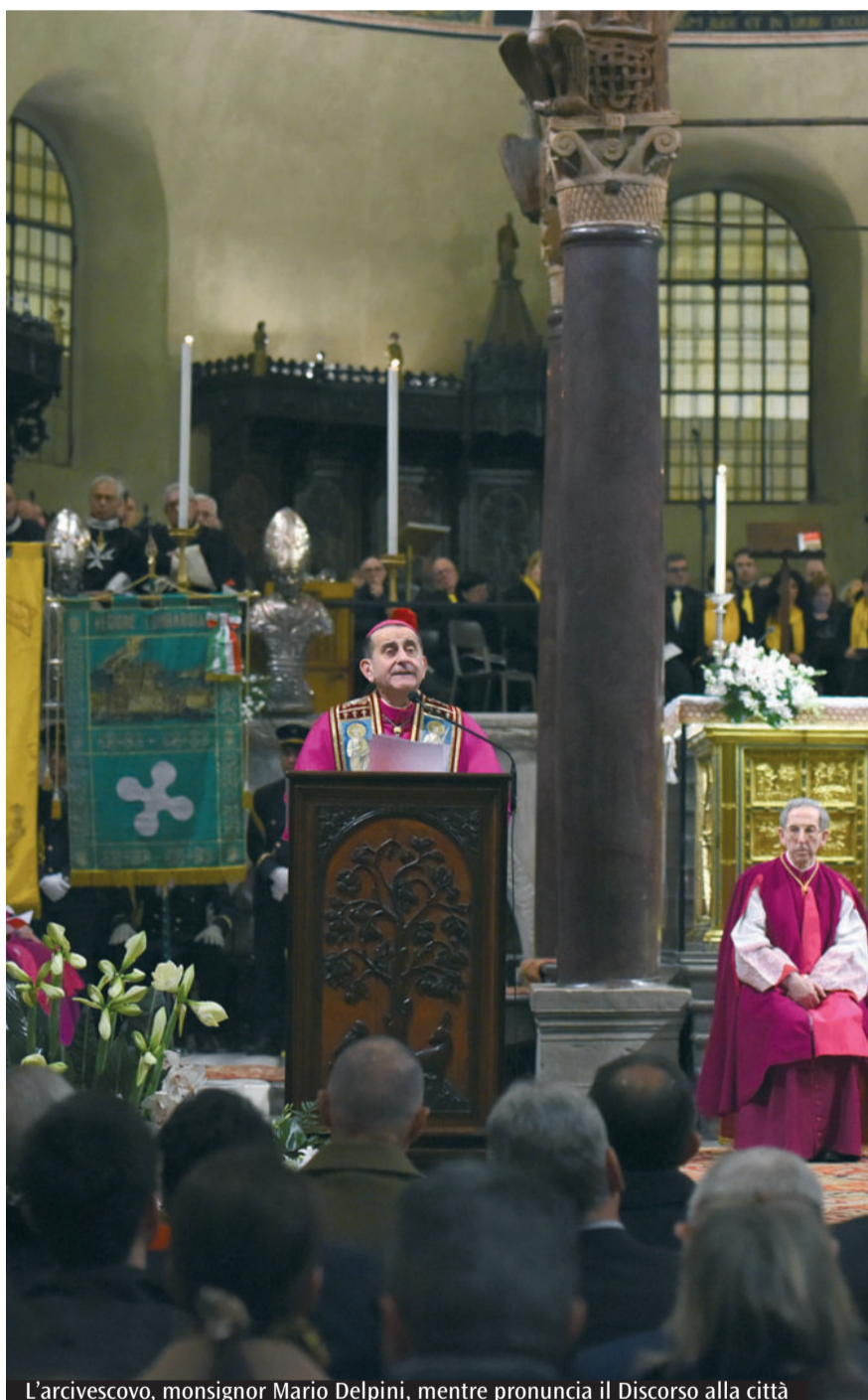
L'arcivescovo, monsignor Mario Delpini, mentre pronuncia il Discorso alla città

«Parlare di formazione della classe dirigente è accettabile soltanto se si conviene che con ciò non si allude a un processo di forgatura di carrieristi o burocrati, ma a una proposta formativa che offra alle nuove generazioni le conoscenze, le competenze e i riferimenti ideali necessari per assolvere responsabilmente i compiti civili ai quali sono destinati in un mondo che si trasforma sempre più velocemente; una classe dirigente formata da persone che, in altre parole, non siano frenate dalla logica dell'autoconservazione, ma desiderino, come diceva padre Gemelli, "perseverare nell'impresa che finisce mai": sviluppare costantemente la propria personalità per il bene proprio e altrui».