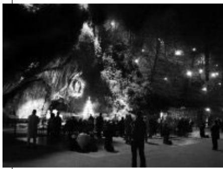
Mille i fedeli che partecipano al pellegrinaggio diocesano guidato dal cardinale Vallini nel santuario mariano francese